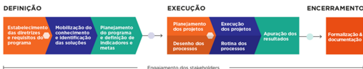
Figura 1: Ciclo de vida dos programas

A figura abaixo demonstra a abordagem metodológica utilizada no desenvolvimento dos programas que estão sob responsabilidade da Fundação Renova.